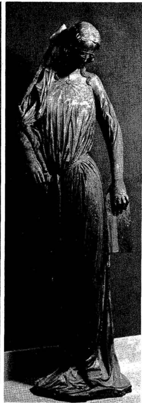
« L'Église » et la « Synagogue »